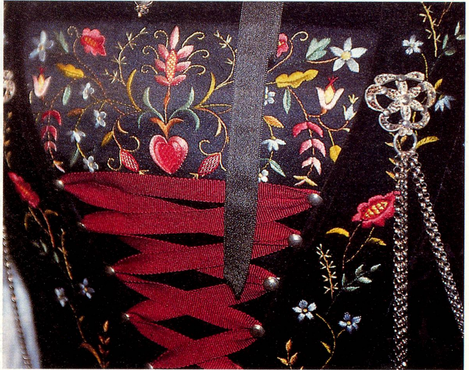
Detail der Festtagstracht aus dem Freiamt, Kanton Aargau.

Im behäbigen Kornhaus Burgdorf, das 1770 erbaut und 1988–1991 renoviert wurde, befindet sich das Schweizerische Zentrum für Volksmusik, Trachten und Brauchtum. Wer ein verstaubtes Museum erwartet, täuscht sich, alles ist auf dem neusten Stand der Technik: Auf der einen Seite des Eingangs läuft eine Multivision, auf der andern Seite an der Kasse erhält jede Besucherin und jeder Besucher mit