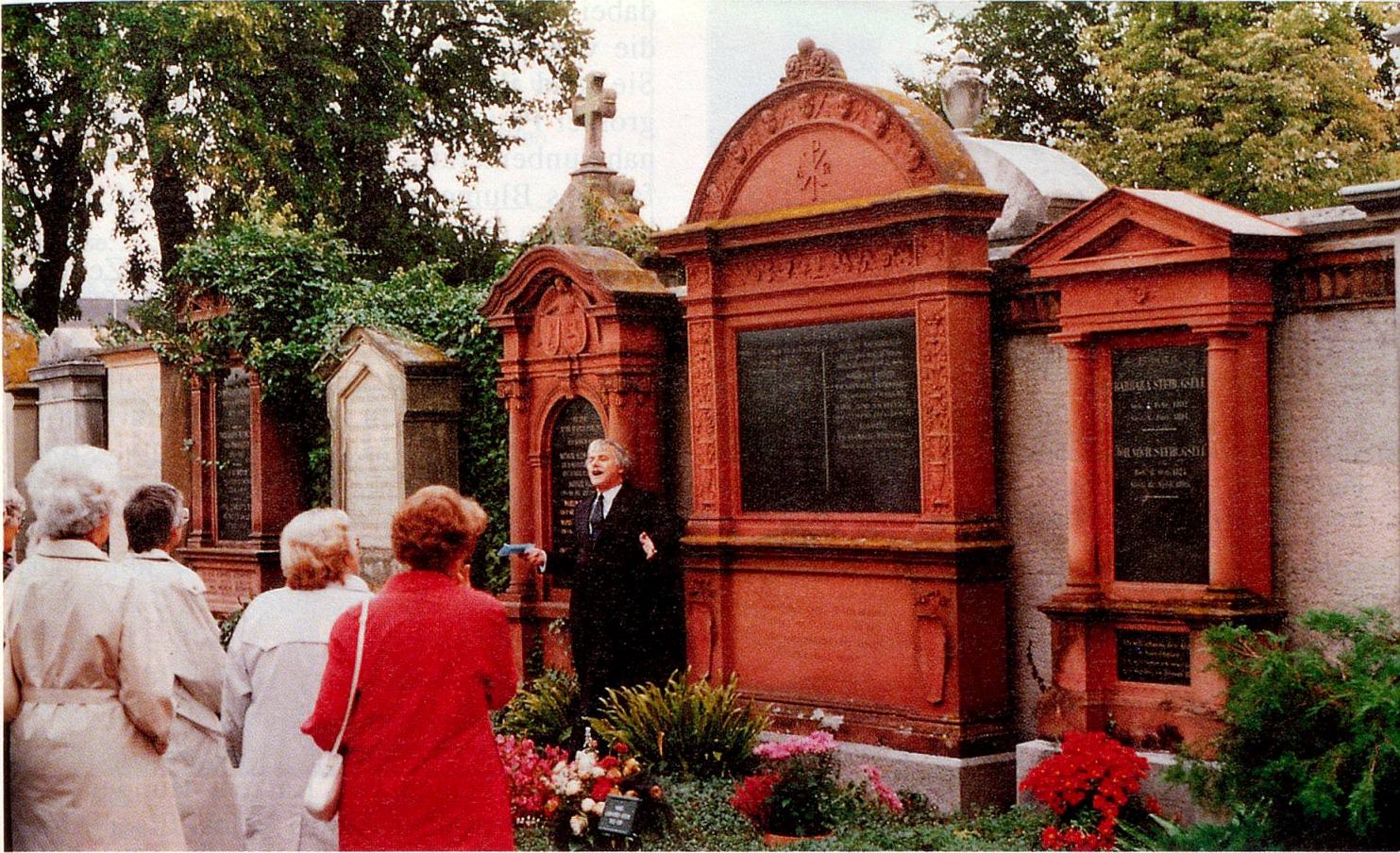
Viele an Gottesacker-Kultur interessierte Menschen schlossen sich letztes Jahr den pietätvollen «Friedhofs-Promenaden» an.

derzusetzen, denn «Tote können geistig noch sehr gegenwärtig sein!»