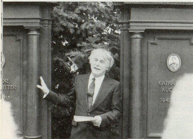
«Zwei sich Liebende konnten im Leben nicht zueinander kommen. Sie liessen sich dafür nebeneinander begraben und dokumentierten ihre Verbundenheit mit den gleichen Grabsteinen.»

dabei ist, dass er in der Zeit zu Hause ist, wo die von ihm beschriebenen Menschen lebten. Sie sind ihm wertvoll, er behandelt sie mit grosser Pietät, stellt auf den Führungen – bei- nahe unbemerkt – bei diesem Grab ein umgefallenes Blumenstößchen wieder auf, wischt bei jenem einen Grabstein sauber.