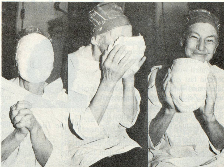
Eine Teilnehmerin freut sich über die gelungene Maske.