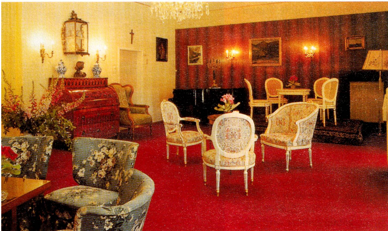
Stilvoller Salon im Künstleraltersheim