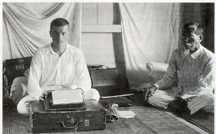
Unterwegs auf dem Flussdampfer