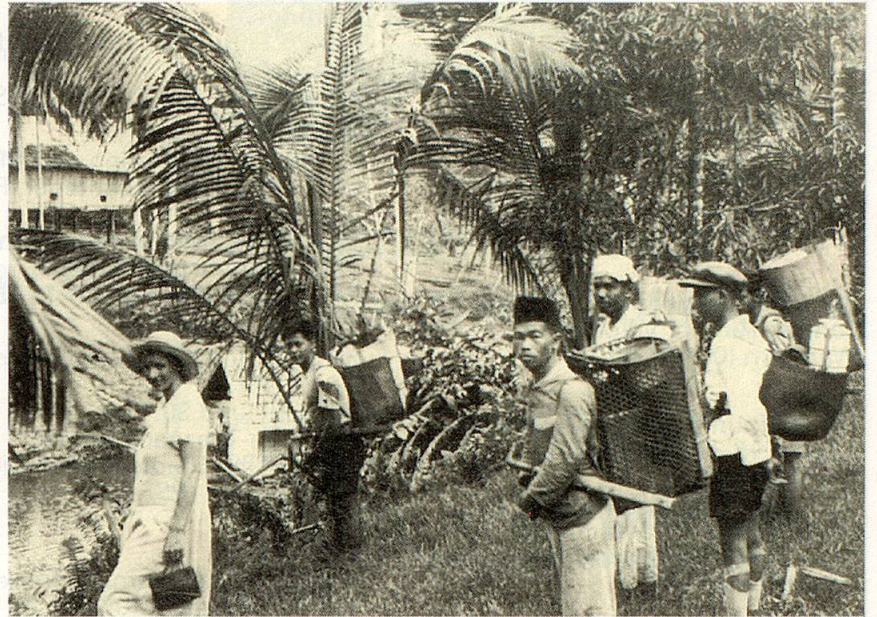
Auf einer Besuchsreise in die Dörfer am Barito