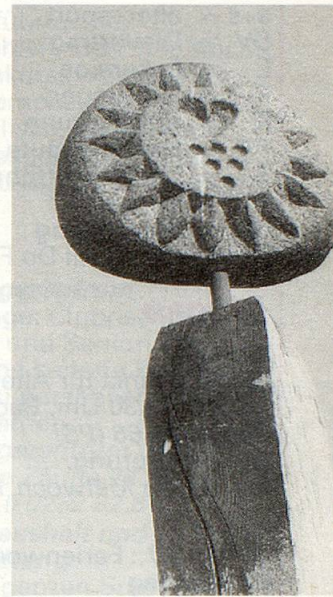
Die erste Steinskulptur