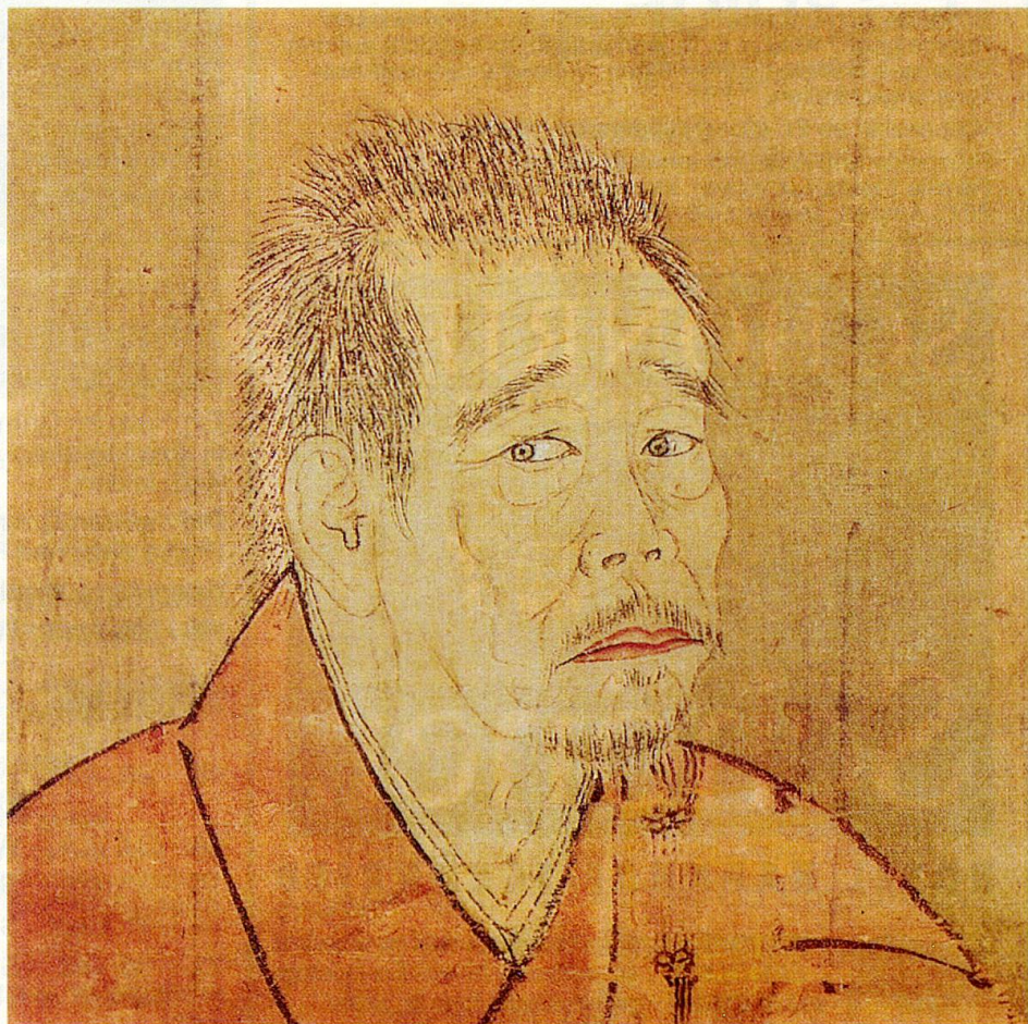
Porträt des Zen-Meisters Ikkyū Sōjun, 15. Jh. (Hängerolle).