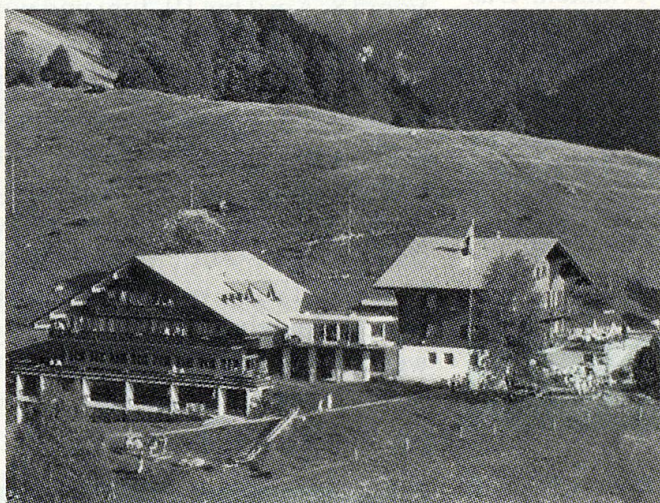
Blaukreuzheim Aeschiried 3703 Aeschi ob Spiez