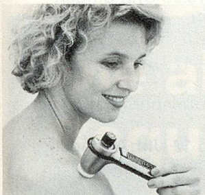
Modell SK2 (100–8000 Schwingungen/Sek.)

Unzählige Menschen jeden Alters in über 15 Ländern greifen in solchen Momenten ganz einfach nach dem NOVAFON-Schallwellengerät. Es bringt ihnen Entspannung, Linderung und Wohlbefinden.