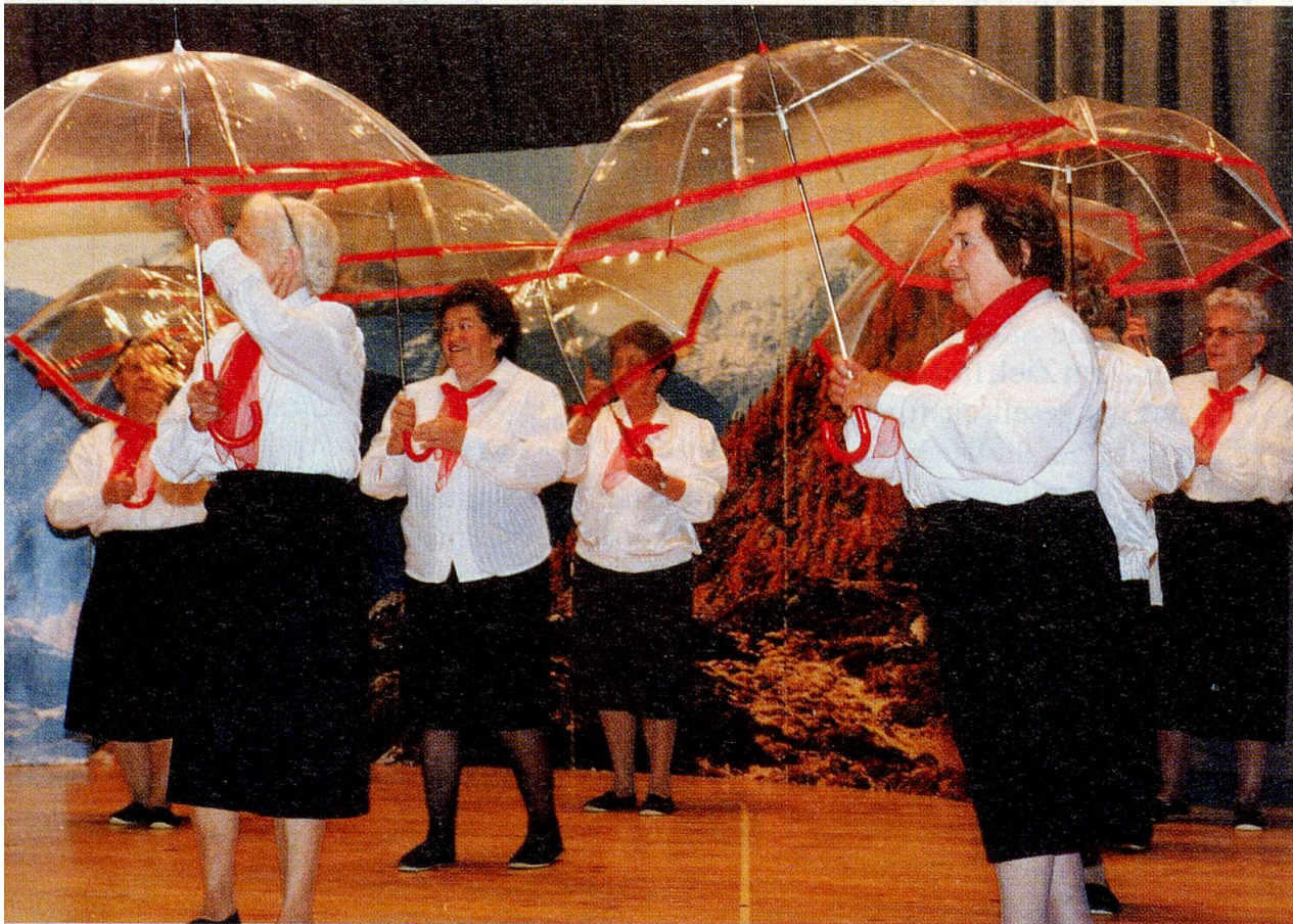
Ideenreiches Turnen mit dem Regenschirm (Gruppe Täsch)

fire und s Mannevolk us de Baize kunnt», um etwas Gescheites zu tun. Er dankte den Anwesenden für ihren Einsatz – sie würden nämlich einer Generation angehören, die immer gezwungen war, hart zu arbeiten – und wünschte, dass sie an diesem Anlass Freundschaft erleben können. Dies würde alle ein bisschen jünger machen.