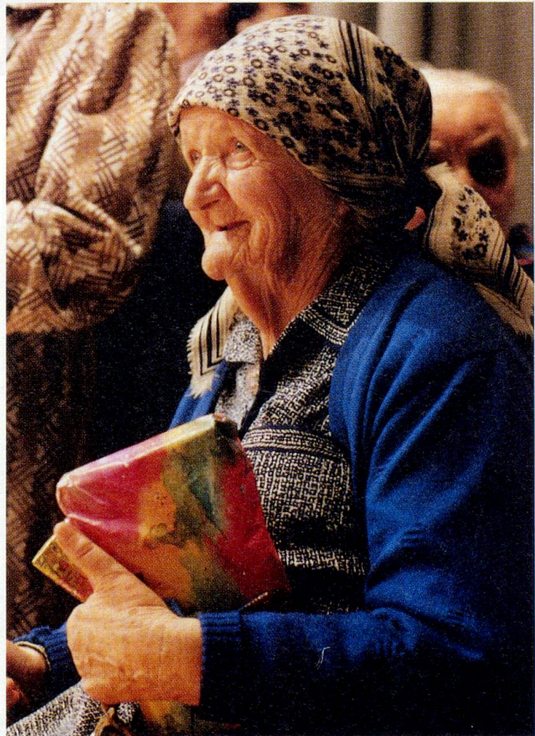
Wer älter als achtzig war, erhielt ein Geschenk. Über den Applaus und das Päckchen freut sich eine rüstige Oberwalliserin.