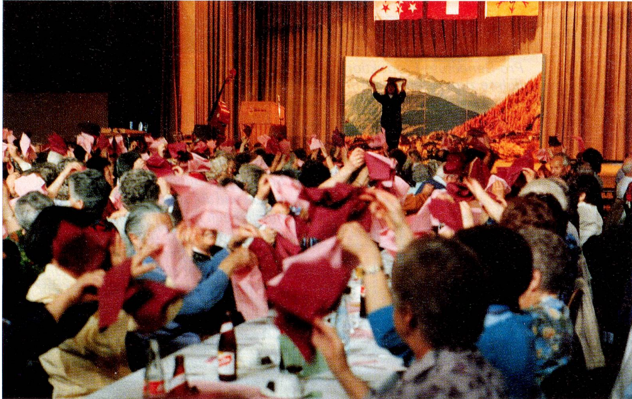
Über 500 Turnerinnen und Turner bei einer gemeinsamen Übung.

S chon zum fünftenmal trafen sich die Sportbegeisterten aus dem Oberwallis zum grossen Turnfest in der Simplonhalle in Brig.