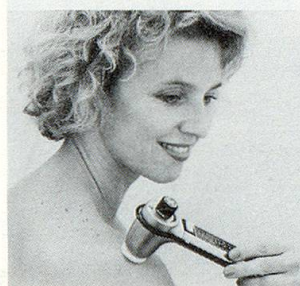
Modell SK2 (100–8000 Schwingungen/Sek.)

Unzählige Menschen jeden Alters in über 15 Ländern greifen in solchen Momenten ganz einfach nach dem NOVAFON-Schallwellengerät. Es bringt ihnen Entspannung, Linderung und Wohlbefinden.