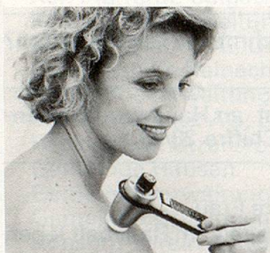
Modell SK2 (100–8000 Schwingungen/Sek.)

Unzählige Menschen jeden Alters in über 15 Län- dern greifen in solchen Momenten ganz einfach nach dem NOVAFON-Schallwellengerät. Es bringt ihnen Entspannung, Linderung und Wohl- befinden.