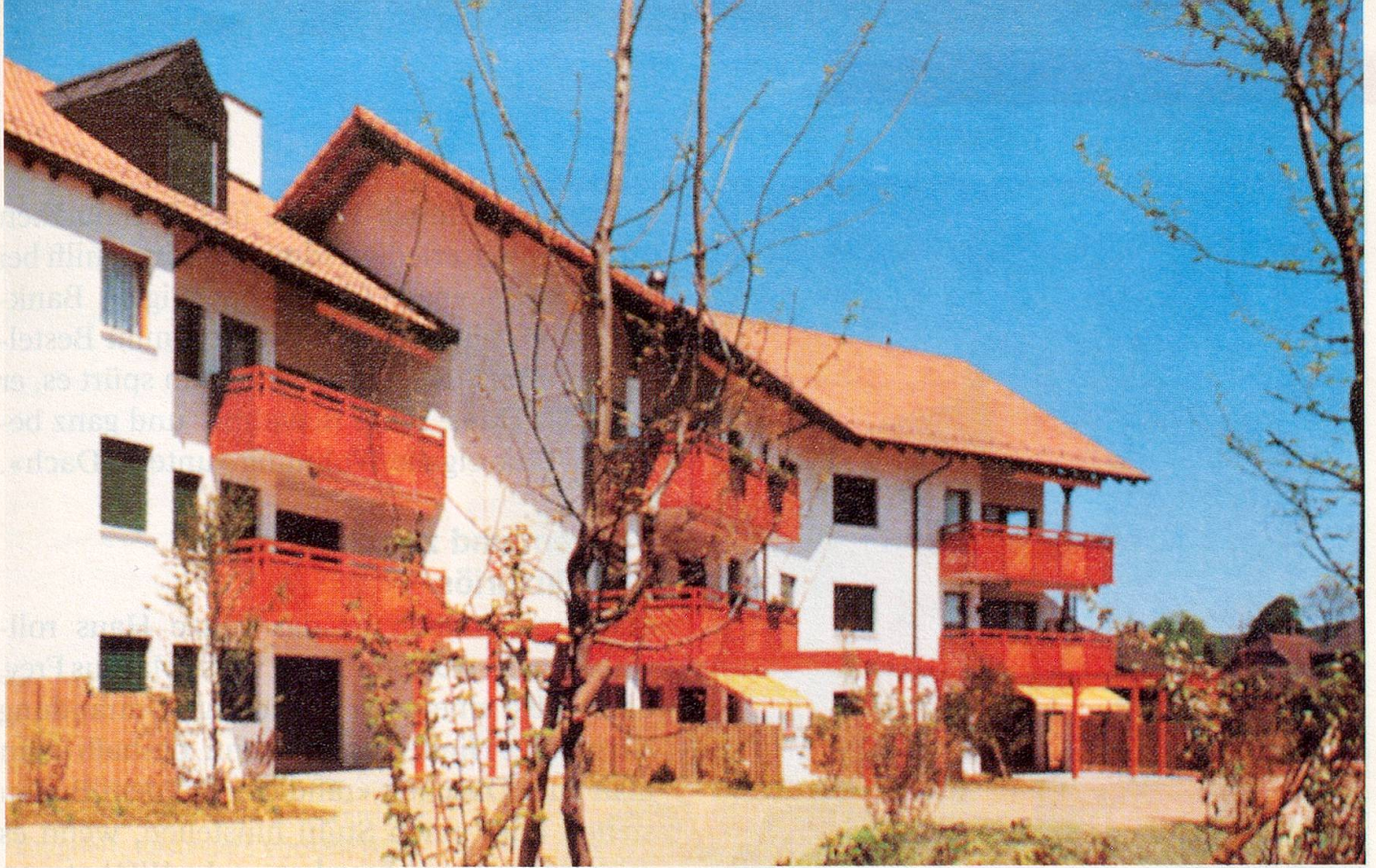
Eines der neuerstellten Senioren-Häuser: Sie stehen wenn immer möglich an zentraler und/oder verkehrsmässig gut erschlossener Lage.

Die zweite wichtige Aufgabe der Sewo ist die Mithilfe bei der Suche nach einer Träger-schaft: Es kommen in erster Linie Privatper-sonen und Organisationen, zum Beispiel Kirchengemeinden, aber auch lokale/regionale Unternehmen, Pensionskassen, Banken, Ver-sicherungsgesellschaften oder die öffentliche Hand in Frage. Nach Möglichkeit werden lo-kale Architekten mit der Planung beauftragt; die Sewo steuert dabei ihre Erfahrungen und Erkenntnisse bei.