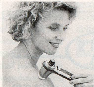
Modell SK2 (100–8000 Schwingungen/Sek.)

Unzählige Menschen jeden Alters in über 15 Ländern greifen in solchen Momenten ganz einfach nach dem NOVAFON-Schallwellengerät. Es bringt ihnen Entspannung, Linderung und Wohlbefinden.