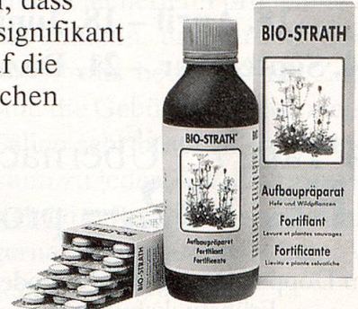
Aufbaupräparat Hefe und Wildpflanzen

BIO-STRATH hilft bei Müdigkeit, stärkt die Widerstandskraft und erhöht die Vitalität. In einem kontrollierten wissenschaftlichen Versuch ist kürzlich festgestellt worden, dass BIO-STRATH einen signifikant positiven Einfluss auf die physischen, psychischen und mentalen Leistungen hat.