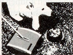
HOKY schluckt alles: Brosmen, Fusseln, selbst Hunde- und Katzenhaare.