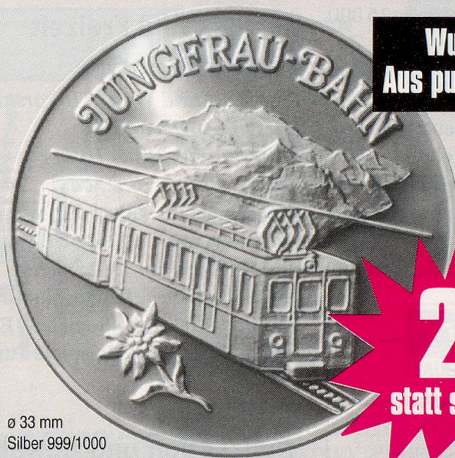
ø 33 mm Silber 999/1000