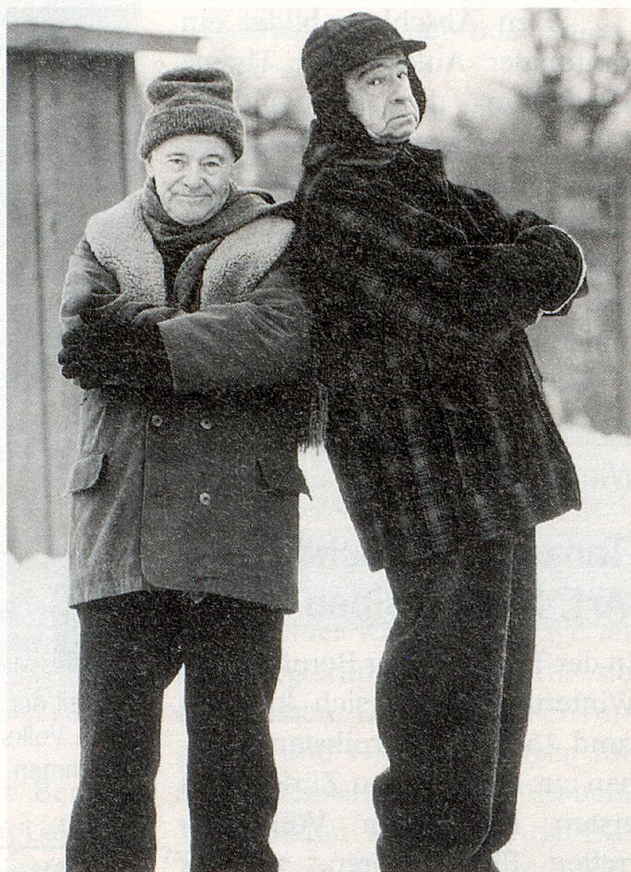
Die beiden seltsamen Erzfeinde Jack Lemmon und Walter Matthau als «Grumpy Old Men» (als verdriessliche alte Knacker).

Jack Lemmon (63) und Walter Matthau (73), die seit einem halben Jahrhundert durch das amerikanische Kino tingeln, treten nochmals gegeneinander an. Sie finden in der Komödie von Donald Petrie das grösste Vergnügen an mehr oder weniger subtilen Formen persönlicher Beleidigungen und einfallsreichen gegenseitigen Attacken. Pfeffer bringt eine attraktive Witwe, für die sie, hoffnungslos komisch, auf die Balztour gehen. In Hollywood-Manier werden Situationen alternder Menschen turbulent und klamaukig, gelegentlich auch derb, abgehandelt und als Höhepunkt zum Happy End an den Traualtar geführt.