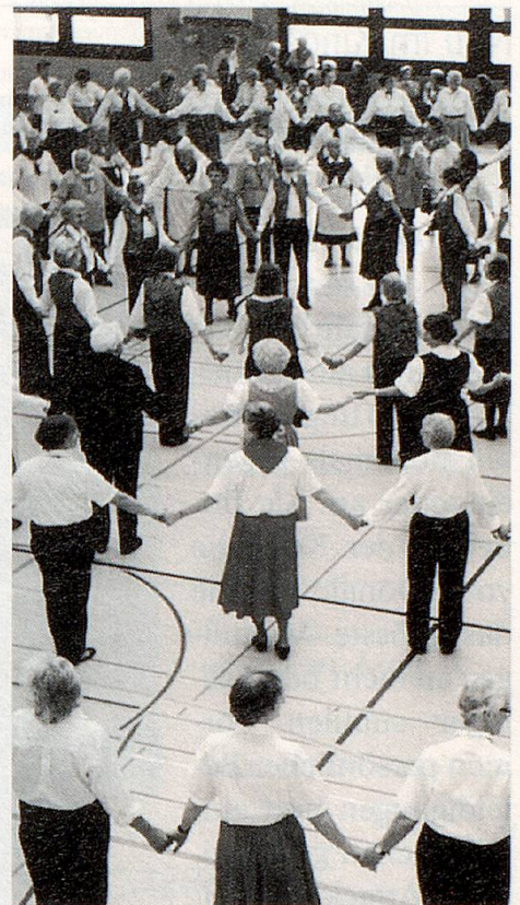
Ein Teil der etwa 400 Personen, die am 1. Volkstanztreffen in Winterthur teilnahmen.