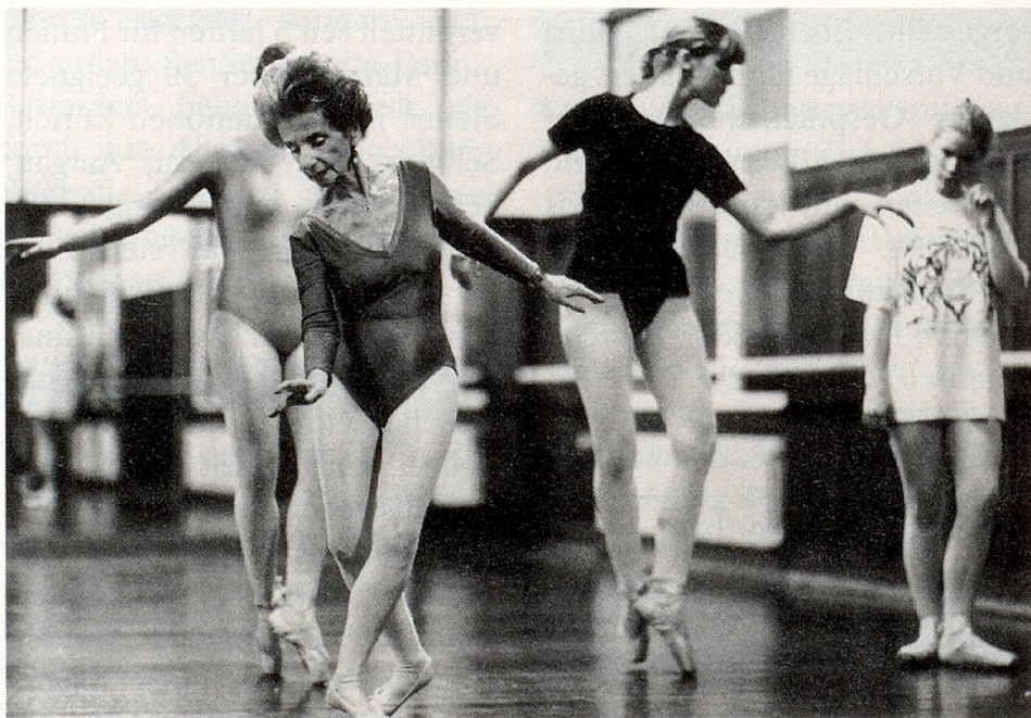
«Ballettstunde», Foto von Peter Fuchs (Buchs SG). Damit errang er den 1. Preis beim «Grossen Fotopreis für den Schweizer Fotografennachwuchs», welcher vom Mode- und Versandhaus Beyeler AG, von der Schweizer Illustrierten und von Nikon organisiert wurde. Thema des Wettbewerbs war: «Die jungen reifen Menschen über Sechzig».

Aufgrund dieser Kleinen Anfrage arbeitete das Amt für Alterspflege in Absprache mit der Fernmeldedirektion und zusammen mit den wichtigsten Institutionen und Organisationen der Alterspflege und -hilfe einen Sammeleintrag «Alter/Betagte» aus. Für die Kosten des Sammeleintrages standen keine Finanzmittel zur Verfügung. Dank der grosszügigen Unterstützung fast aller im Sammeleintrag erwähnten Institutionen und Organisationen konnte das in der Schweiz einzigartige Vorhaben realisiert werden. Und so finden nun alle auf schnelle und einfache Weise alle nötigen Adressen, welche das Alter betreffen, unter dem Stichwort «Alter/Betagte» im Telefonbuch. Dazu verhelfen vor allem die unter die Stichworte wie zum Beispiel