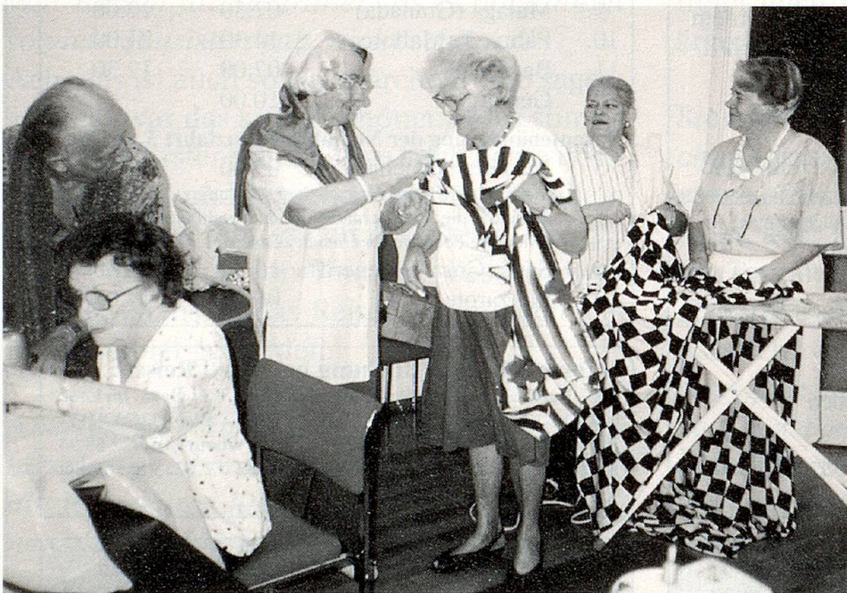
Teilnehmerinnen und Teilnehmer des Projekts «Theater 55 plus» beim Schneiden der Kostüme.

Einerseits gilt es also, sich die Daten für die Aufführungen