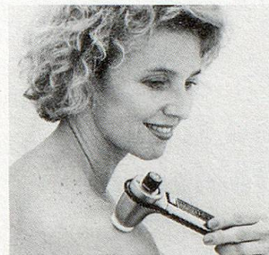
Modell SK2 (100–8000 Schwingungen/Sek.)

Unzählige Menschen jeden Alters in über 15 Ländern greifen in solchen Momenten ganz einfach nach dem NOVAFON-Schallwellengerät. Es bringt ihnen Entspannung, Linderung und Wohlbefinden.