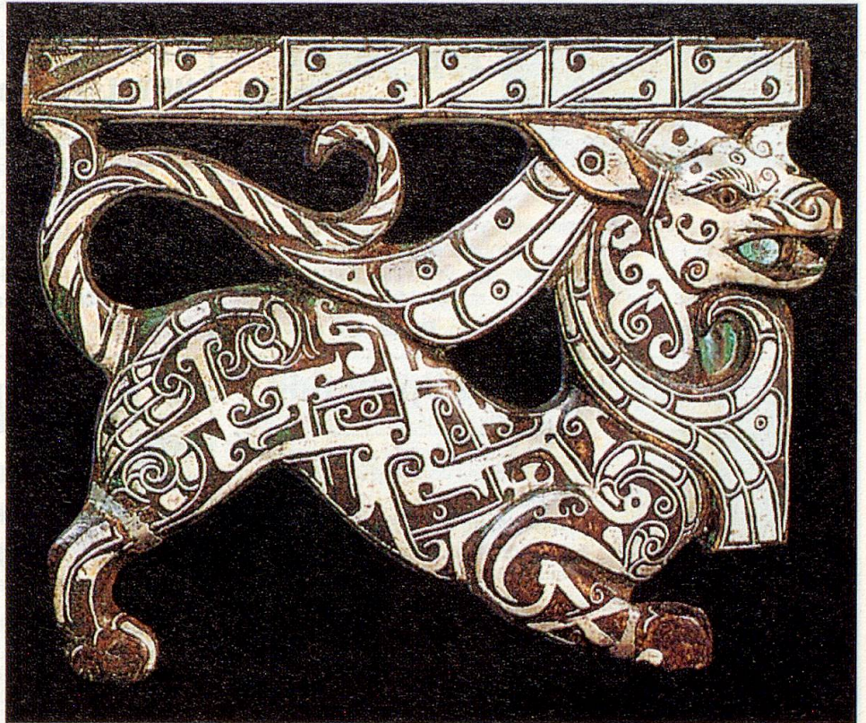
Tragendes Eckstück in Tigergestalt vermutlich für ein Tischbein aus der Zhou-Dynastie (ca. 1100–256 v. Chr.)

Museum Rietberg, Gablerstr. 15, 8002 Zürich, Öffnungszeiten Di. bis So 10–17 Uhr, öffentliche Führung So 11 Uhr, Do. 12.15 Uhr Führung mit chinesischem Imbiss, Tel. 01/202 45 28