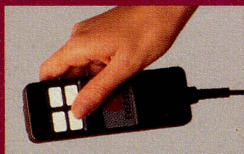
Das elektrische Steuergerät (auf Wunsch).

GUTSCHEIN bitte in Blockschrift ausfüllen, ausschneiden und senden an: EVERSTYL AG, Postfach 534, Isteinerstrasse 84, 4021 Basel.