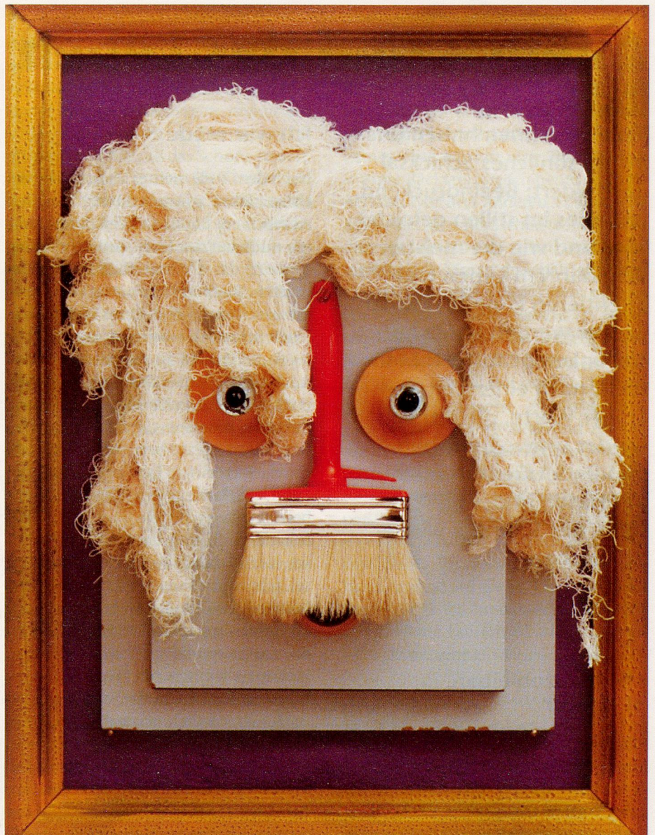
Unkonventionell und witzig sind seine neusten Schöpfungen, die er auch «Cabaretismen en Peinture» nennt. Titel dieses Werkes: «Selbstbildnis».