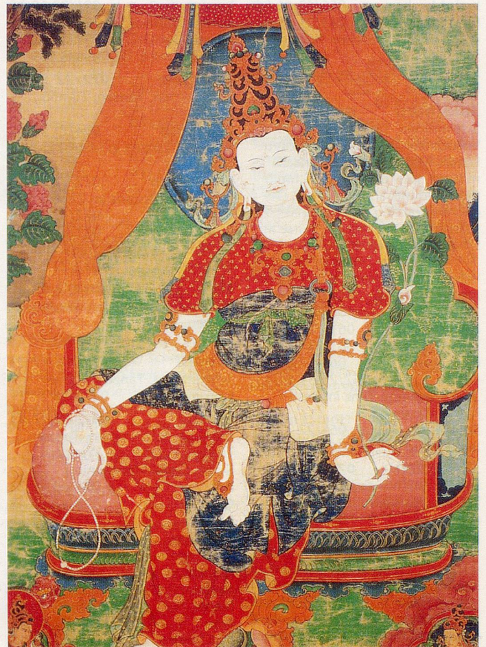
Thangka (Ausschnitt): König Pundarika von Sambhala Wasserfarben auf Stoff, Osttibet, 17./18. Jahrhundert n. Chr.

Tibet, im Herzen Asiens gelegen und ein Gebiet von fast zwei Mio. Quadratkilometern umfassend, brachte eine einzigartige und bedeutende Kultur hervor, die sich dem Streben nach Innerlichkeit, Frieden und Erleuchtung widmete. Das «Tibet House Museum» in New Delhi in Indien versteht sich als Bewahrer des tibetischen Kulturerbes und als weltoffenes Zentrum für tibetische und buddhistische Studien. Aus Anlass des 60. Geburtstages des Dalai Lama und des 30-jährigen Bestehens des «Tibet House» wird nun erstmals eine im Westen noch nie gezeigte Sammlung von Tempelbildern einem interessierten Publikum zugänglich gemacht. Unter dem Titel «Mitleid und Wiedergeburt in der tibetischen Kunst» sind in der St. Galler Sammlung für Völkerkunde 30 dieser Thangkas sowie zwei Manuskripte zu sehen. Die Thematik der Thangkas und Bücher kreist