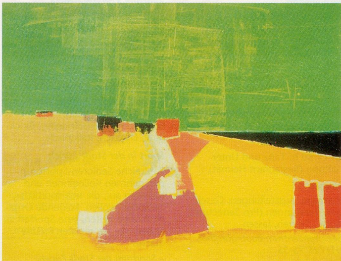
Sicile, 1954. Huile sur toile 114x146 cm. Musée de Grenoble.