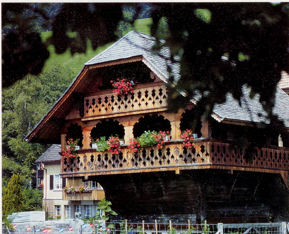
Schatzkammer des Hofes ist immer der Speicher, wo die Kornvorräte, Saatgut, Stoffe, Trachten und Schmuck aufbewahrt werden.

Nicht umsonst heisst es in dem auf den wohlhabenden Küherstand gemünzten Liedtext «Niene geit's so schön u luschtig, wie bi üs im Ämmital ...». Mit seinen Hügeln oder Högern, wie die Einheimischen sagen, den Gräben und Eggen, den Dörfern und heimeligen Einzelhöfen ist das Tal entlang der Emme ein ideales Ausflugs- und Wandergebiet. In der Emmentaler Schaukäserei in Affoltern können Interessierte bei der Entstehung eines Käselaiibes selber Hand anlegen.