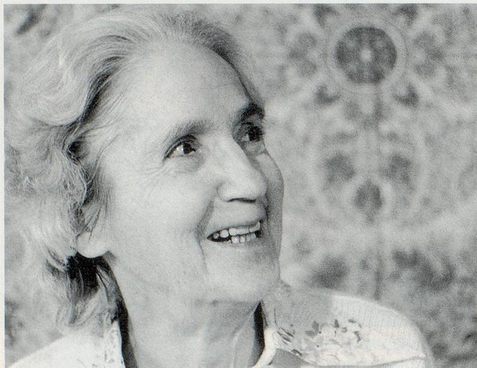
Fotos als Ausgangspunkt intensiver Selbstbetrachtung und Selbstbefragung. – Dani Zacchi und Catharine Gardiol porträtierten Besucher und Besucherinnen.

Dani Zacchi und Catharine Gardiol haben im Foyer de jour «Le Caroubier» in Genf ihre Besucher eingeladen, sich von ihnen fotografieren zu lassen. Diese stellten sich in «Pose», gestalteten mit der Fotografin zusammen ein persönliches Bild von sich. Die Fotos wurden zum Ausdruck einer intensiven Selbstbefragung und Selbstbetrachtung der alten Menschen, einer «Pause», die sie sich gönnten.