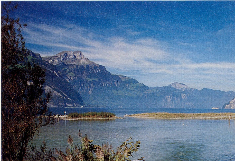
Die Gäste des Hotels goldener Schlüssel erwartet eine wunderschöne Gegend: Vierwaldstättersee mit Niederbauen Chulm (links).