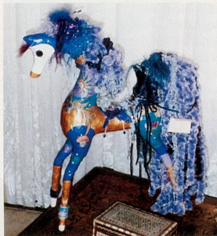
Erinnerungsstücke und Geschenke von Berühmtheiten aus aller Welt.

Wenn sie einen ihrer häufigen Märchennachmittage abhält, so findet sie meistens drei Generationen versammelt: Eltern mit ihren Kindern. Und Grosseltern (manchmal sogar Urgrosseltern) mit ihren Enkelkindern. Und es