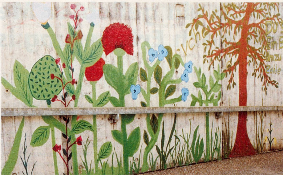
Die bemalten Wände der Bahnunterführung in Niederwangen.