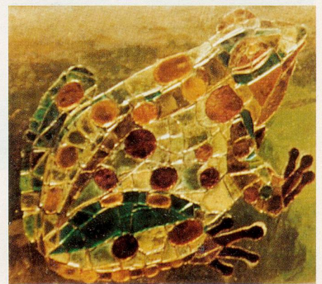
Ein Glasmosaik ziert den Gartenvorplatz.

schmückt mit hölzernen Bänken, die sie aufgetrieben und teilweise selber mit dem Auto nach Niederwangen gebracht hat. Etwas Ärger hat sie heute mit den ebenfalls herangeschleppten grossen Blumenbehältern. Seit dem nach Vollendung ihres Werks organisierten Bahnhofsfest im Jahr 1990