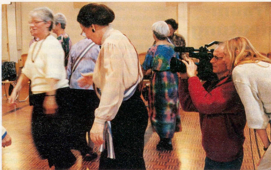
Bei den Dreharbeiten des Alter+Sport-Films.

Der Bereich Bildung des Schweizer Fernsehens DRS zeigt in seinem neuen Gefäss «Infothek» von April bis Juli 1995 den dreiteiligen Film «Mit Menschen – Wer ist denn hier normal?» von Bruno Kiser zum Thema Kommunikation mit Behinderten. In 9 Kurzporträts schildern Menschen mit Behinderungen typische Erlebnisse, die sich zwischen ihnen und Nichtbehinderten getragen haben. Was es braucht, um die Verständigung zwischen Behinderten und Nichtbehinderten zu erleichtern? Das versuchen die Protagonisten zusammen mit ihren Partnern und Fachleuten an einem Arbeitswochende herauszufinden.