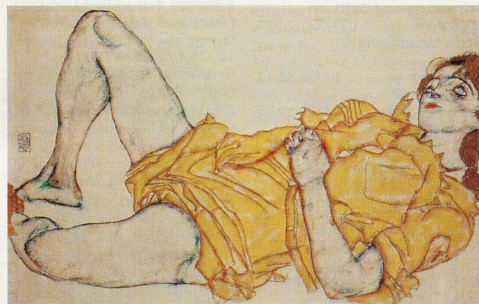
Liegende Frau in gelbem Hemd, 1914

In Mendrisio sind im Museo d'Arte im ehemaligen Kloster der Frati Serviti bis am 25. Juni Werke von Meret Oppenheim zu sehen. Telefon 091/46 76 49).