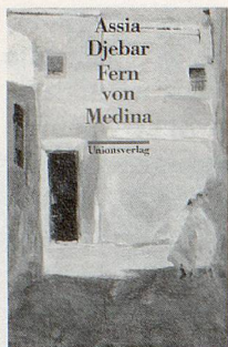
Assia Djebar Fern von Medina Roman Unionsverlag Zürich, 395 S., Fr. 44.–

Assia Djebar, 1936 in Algerien geboren, ist die bedeutendste Autorin des Maghreb. In ihren Büchern, für die sie unter anderem mit dem Literaturpreis des Ökumenischen Zentrums Frankfurt ausgezeichnet wurde, behandelt sie den Konflikt zwischen der islamischen und der westlichen Kultur. In «Fern von Medina» beschwört sie mit der für sie charakteristischen Mischung aus überlieferten Fakten und Fiktion die Geburtsjahre des Islam, und zwar aus der Sicht derjenigen, die von der traditionellen Geschichtsschreibung so gerne vernachlässigt werden, der Frauen. In den klassischen Chroniken der islamischen Tradition hat Assia Djebar oft nur durch ein Wort, eine Zeile oder einen Satz ange deutete Spuren von Frauen gefunden. Sie hat ihnen Gestalt und Stimme gegeben, und erzählt ebenso poetisch wie realistisch von ihren Kämpfen, ihrer Liebe, ihrer Macht und ihren Abenteuern. Das Buch beginnt in Medina, mit dem Tod des Propheten Mohammed im Jahr 632. Obwohl oder vielleicht gerade weil manche der zu neuem Leben erweckten Figuren so fremd anmuten, zieht einen das Buch in seinen Bann.