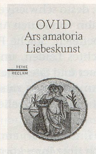
OVID Ars amatoria Liebeskunst REIHE RECLAM Philipp Reclam jun., Stuttgart, 294 S., Fr. 21.–