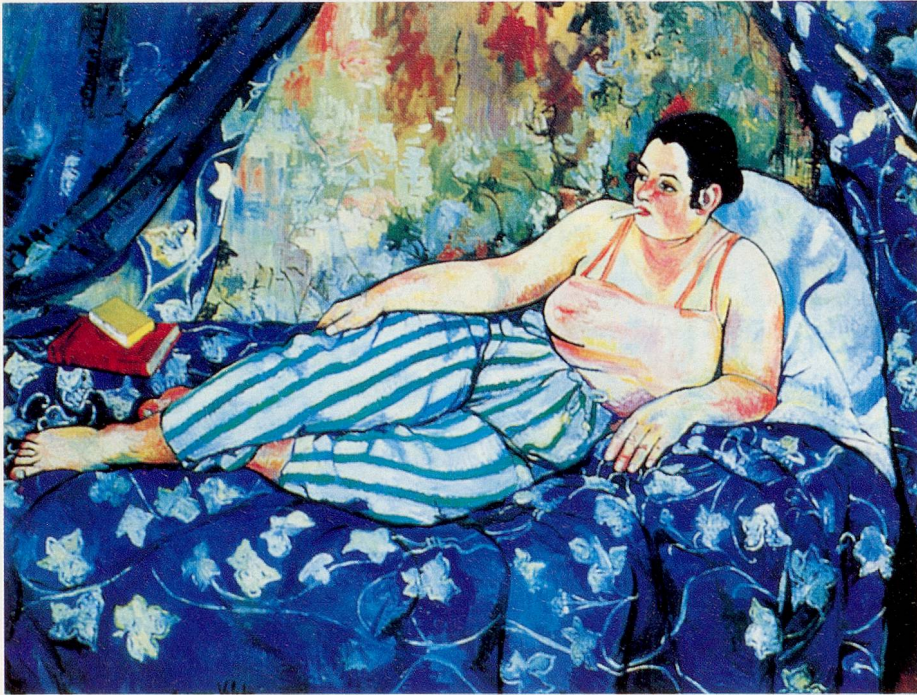
La chambre bleue, Suzanne Valadon, 1923