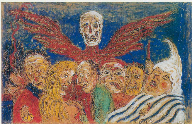
James Ensor. Die vom Tod beherrschten Todsünden, 1904

Geöffnet sind die Ausstellungsräume an der Avenue des Bergières 1 in 1004 Lausanne dienstags bis sonntags 11 bis 13 Uhr und 14 bis 18 Uhr.