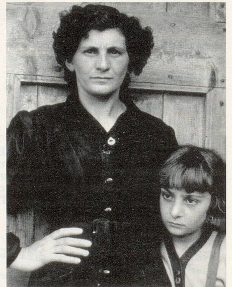
Paul Strand: The Post Mistress and Daughter, 1953

«Eine Photographie ist dann ein Porträt, wenn man glaubt, den Menschen auf dem Bild zu kennen und sich an ihn zu erinnern, selbst wenn man ihm nie begegnet ist.» Das Zitat stammt von Paul Strand, von ihm ist noch bis zum 31. März im Kunsthaus Zürich die Ausstellung «Die Welt vor meiner Tür», Photographien von 1950 bis 1976, zu sehen. Der 1890 in New York geborene und 1976 in seinem Haus im kleinen französischen Dorf Orgeval bei Paris gestorbene Paul Strand ist vielleicht der bedeutendste Photograph überhaupt. Mit seiner unvergleichlichen Bildsprache hat er das Medium unseres Jahrhunderts geprägt wie kein anderer. Akribische technische Sorgfalt, Dokumentation und Kunst verbinden sich bei ihm zu einem Lebenswerk, das beispielgebend für unzählige Photographengenerationen wurde. Aus seinen Bildwerken, abstrahierte Gegenstände und Objekte im Frühwerk, Natur und Landschaft oder eben der Mensch, spricht jenes Zeitlose, das allgemeingültige Werte setzt. «Die Natur und die Menschen sind auf Strands Bildern wie in den unabänderlichen Lauf der Dinge einge-