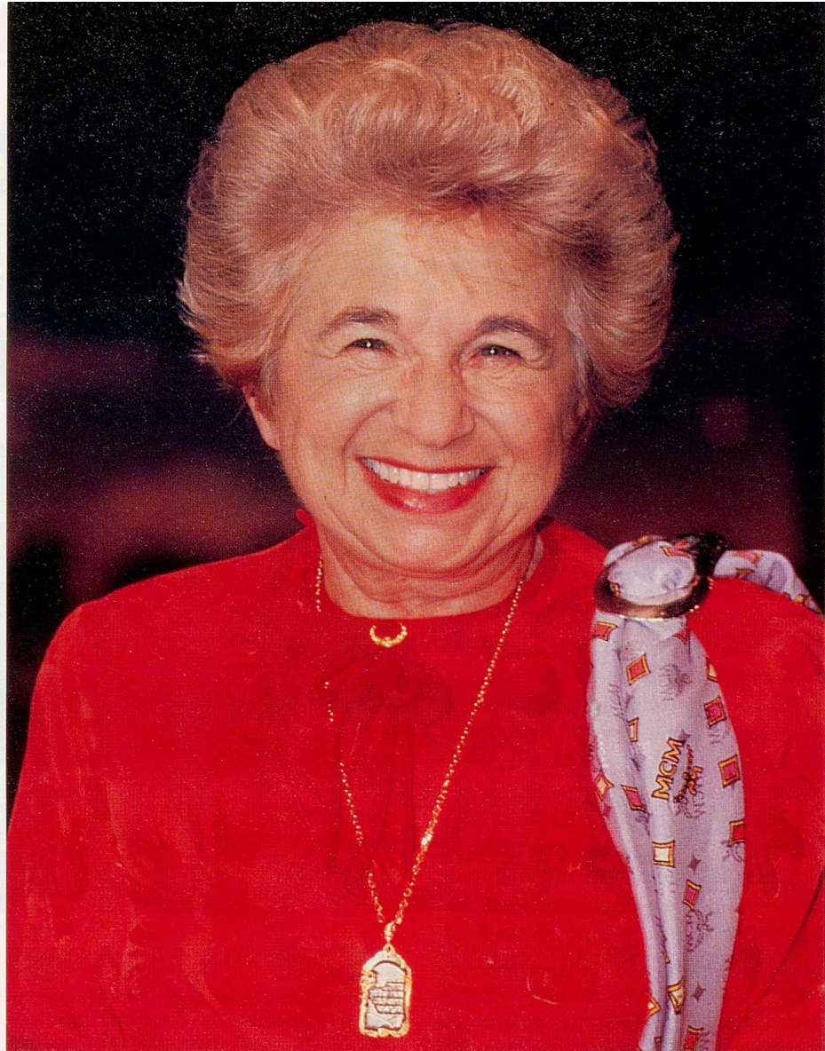
Ruth C. Westheimer. Als «Dr. Ruth» genießt die Sexualberaterin mit ihren Fernsehsendungen weltweite Popularität und Anerkennung.

Liebe im Alter? Sie ist nicht zu vergleichen mit der stürmisch-leidenschaftlichen Liebe in der Jugend. «Das Alter muss man schonen und es so respektieren, wie es ist.» Je bewusster man sich und seiner Lebenssituation begegnet, desto weniger läuft man auch Gefahr, von unrealistischen falschen Erwartungen enttäuscht zu werden.