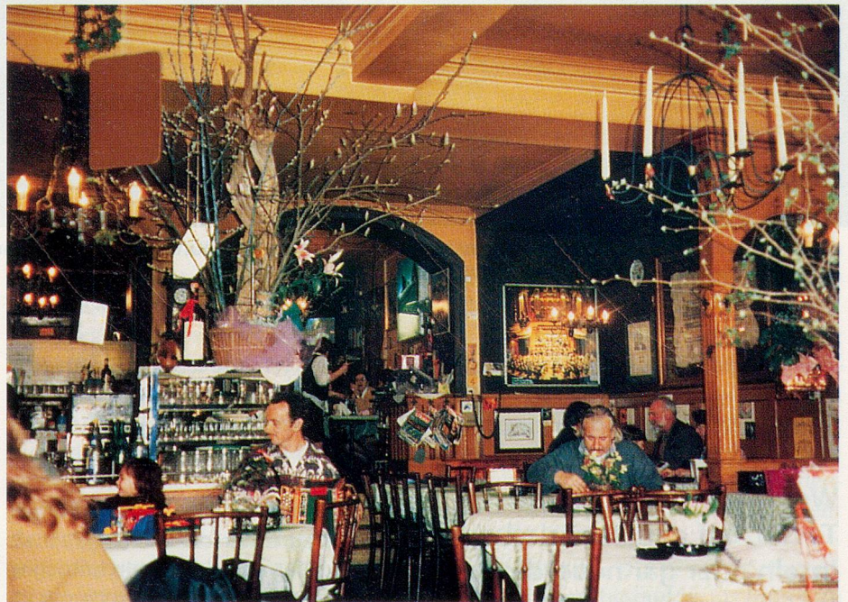
Die Atmosphäre im Café Gothard

Wer Freiburg besucht, sollte die Stadt nicht verlassen, ohne ein typisches Café besucht zu haben. Bisher war vor allem die Rede von den städtebaulichen Vorzügen einer Stadt, die auch in menschlicher Hinsicht einiges zu bieten hat. Als Lokal mit einer im besten Sinne originellen Atmosphäre könnte das «Café du Gothard» empfohlen werden. Besonders fröhlich geht es dort jeweils abends zu, doch auch am späteren Nachmittag und sogar am Morgen schon erahnt man etwas von der unverwechselbaren Stimmung des immer