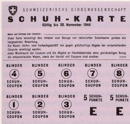
Schuhkarte aus dem Jahre 1944.

ahnten noch nichts von den Greuel- taten, und wenn gerüchteweise etwas durchsickerte, glaubten wir es einfach nicht.