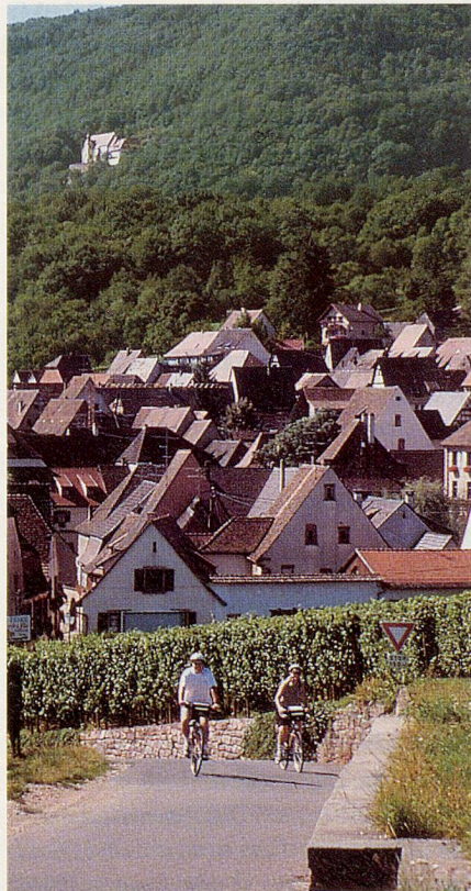
Erholung bei Radfahren und Schlemmen im Elsass.

Auch in diesem Jahr lockt «La Bicyclette Gourmande» zum Einsteigen oder Umsteigen aufs Velo. Der Elsässer Veranstalter bietet Veloreisen auch für Ungeübte mit Aufhalten in ganz besonders charmanten Hotels und – wie der Name La Bicyclette Gourmande sagt – in ausgewählten Gourmet-Restaurants an. Die bisherigen Arrangements führten durchs Elsass, nach Italien, Luzern und ins Berner Oberland. «Ich habe schon viele Veloreisen in