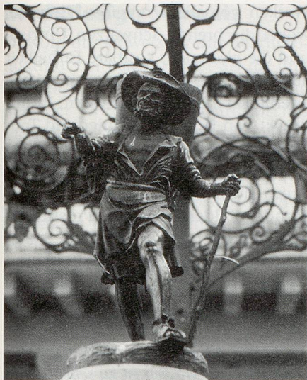
Zürich: Weinmarktbrunnen auf dem Weinplatz in der Altstadt.