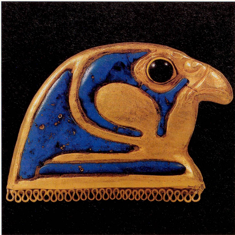
Falkenkopf aus Gold und mit Einlagen aus mehrfarbigen Glaspasten. Endstück eines Halskragens aus der Privatsammlung Schindellegi (Höhe 2 cm).