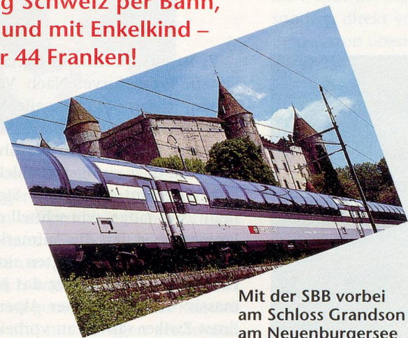
Mit der SBB vorbei am Schloss Grandson am Neuenburgersee

Ein Tag Schweiz per Bahn, Schiff und mit Enkelkind – für nur 44 Franken!