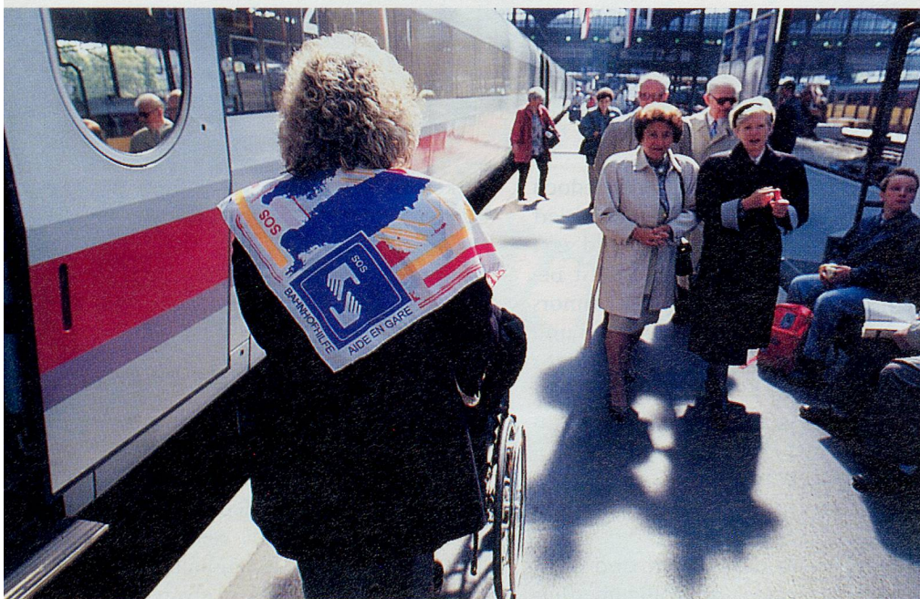
Helferin im Einsatz auf dem Basler Bahnhof SBB: Für Reisende mit körperlichen Behinderungen eine ganz wichtige Unterstützung.