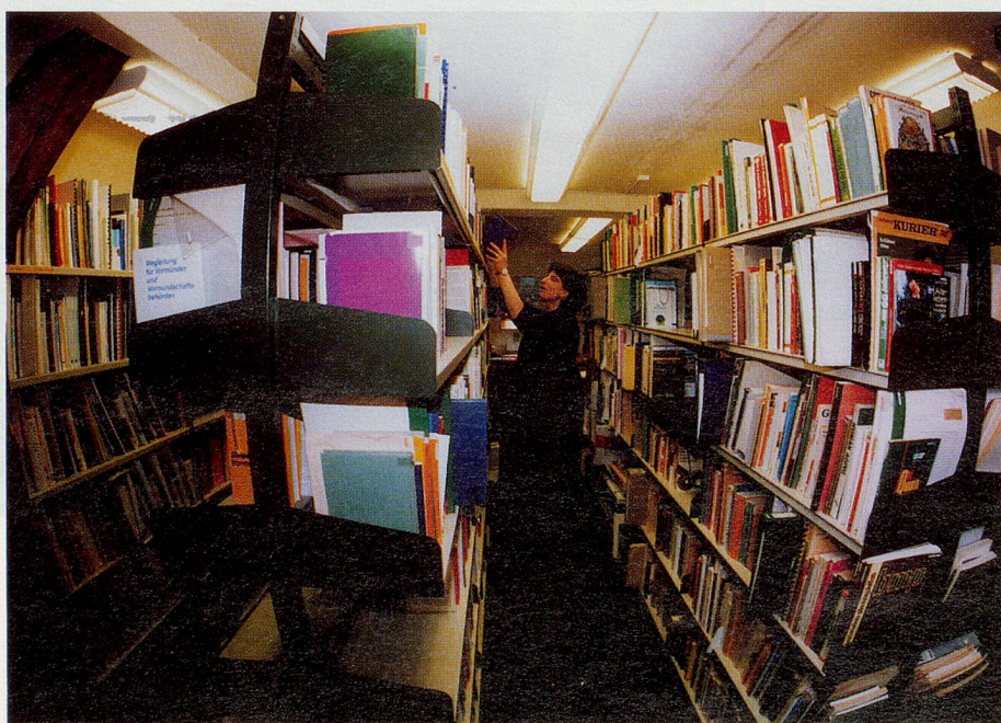
Beinahe 20 000 Bücher über Altersfragen stehen Interessierten zur Verfügung.