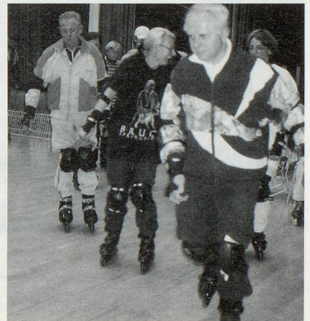
Inline-Skating macht nicht nur jungen Leuten Spass.

Pixel Inline Skating-Schule, Oberdorfstr. 19, 8934 Knonau, Tel. 01/767 19 31.