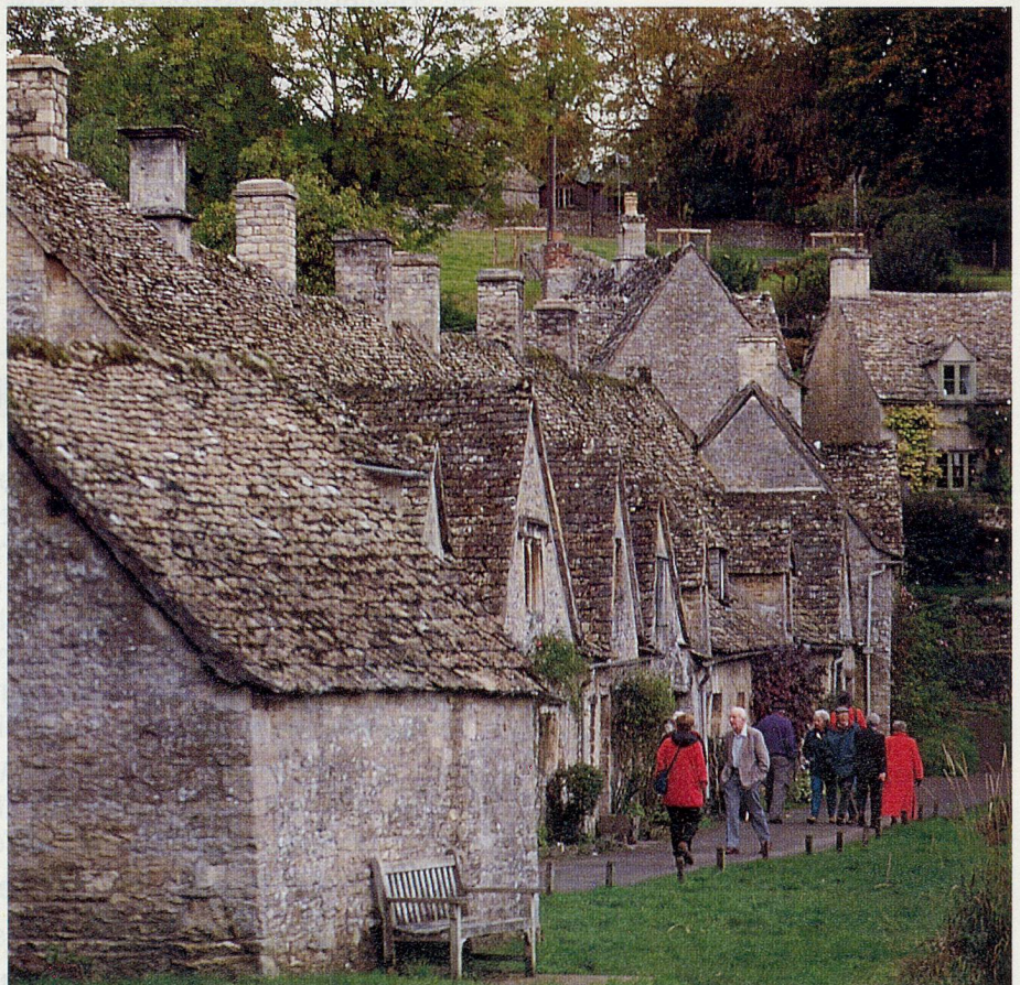
Historische Idylle in Bibury: Die alten Weber-Cottages, die heute dem National Trust gehören und von ihm auch verwaltet und vermietet werden.

Im Süden liegen die alte Römerstadt Cirencester, die Stroud Täler mit ihren Wollspinnereien aus dem 18. und 19. Jahrhundert und das museale Dörfchen Bibury, das vom berühmten englischen Maler und Kunstgewerbler William