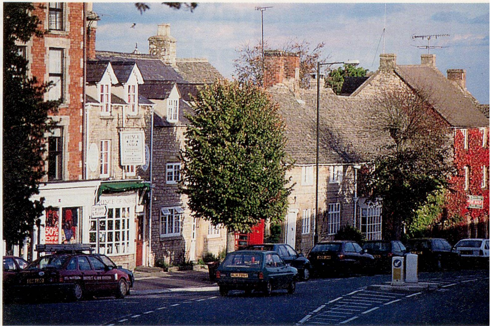
Stow-on-the-Wold: Ein geschäftiges Marktstädtchen und Antiquitätenzentrum mit über 40 Antique Shops, zahlreichen Kunstgalerien und Buchläden.

Von dort in Richtung Northleach und Bourton-on-the-Water gelangt man nach Stow-on-the-Wold. Ein historisches Marktstädtchen, das sich heute zu einem bedeutungsvollen Antiquitäten-Zentrum entwickelt hat. Auch wenn man sich nicht für altes