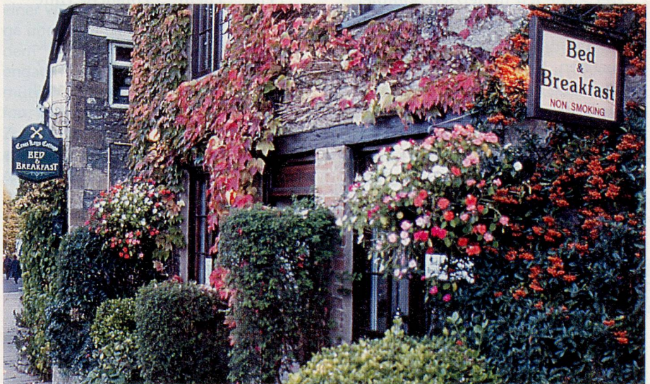
Nebst guten Hotels zu moderaten Preisen findet man in den Cotswolds überall zauberhafte Bed & Breakfast-Häuser wie hier in Stow-on-the-Wold.

Silber oder alte Möbel interessiert, so sollte man allein der zahlreichen romantischen B&B-Häuser und schönen kleinen Hotels wegen dort wenigstens einmal übernachten. Und wer in völliger Abgeschiedenheit ein aussergewöhnliches Luxushotel sucht, findet dieses auf dem Weg nach Chipping Camden, einer weiteren wunderbaren Marktstadt. Charingworth Manor heisst dieser Geheimtip im winzigen Dörfchen Charingworth. Ein Haus aus dem 14. Jahrhundert mit Komfort und Luxus des zu Ende gehenden 20. Jahrhunderts mit einer hervorragenden