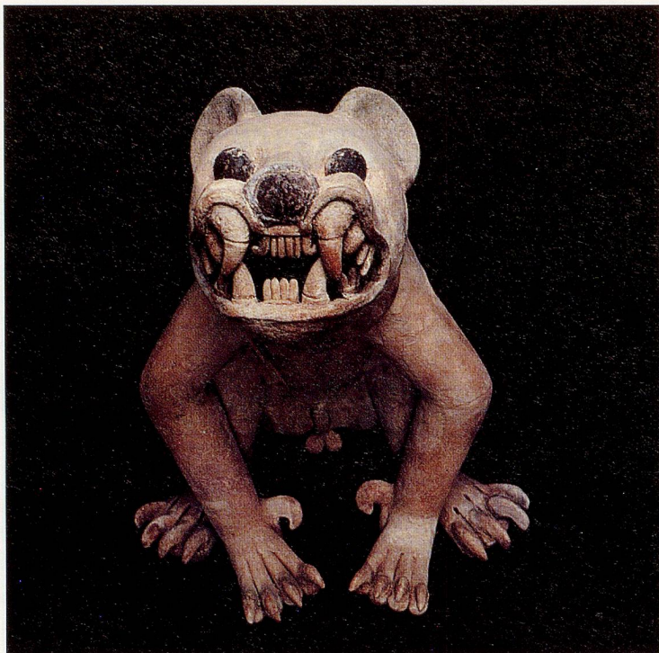
Unbekannte mexikanische Kunst in Zürich: Jaguar aus gebranntem Ton aus der klassischen Veracruz-Kultur (600 bis 900 n.Chr.)