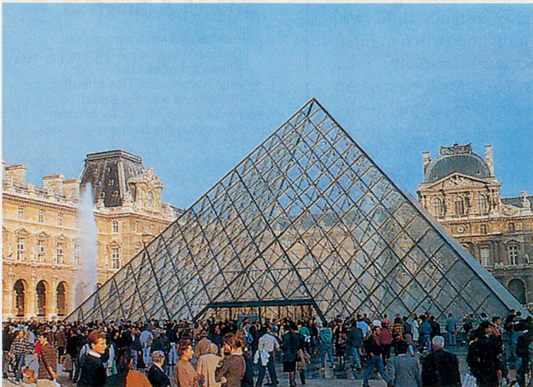
Der Louvre mit der berühmten Pyramide