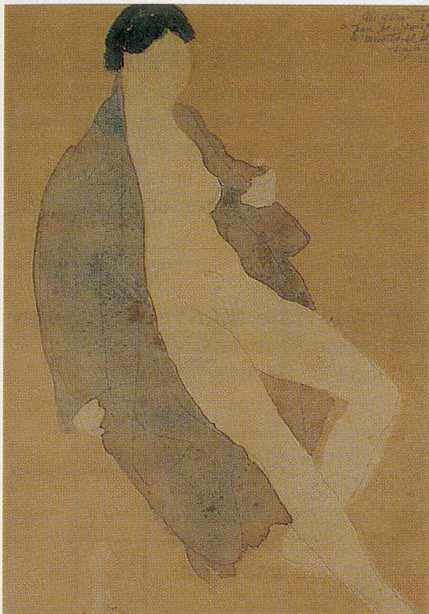
Auguste Rodins Aquarell «Femme au vêtement entrouvert»

Zwei Künstlerpersönlichkeiten an der Wende zum 20. Jahrhundert, welchen eine epochale Bedeutung zukommt, widmet Paris zwei eigene Museen: Auguste Rodin (1840–1917) und Pablo Picasso (1881–1973). Rodins Werk im Hotel Biron neben dem Dôme des Invalides, das 1728 inmitten einer grünen Insel im Herzen von Paris erbaut wurde; Picassos Werk in einem der schönsten Adelshäuser des Marais-Viertels.