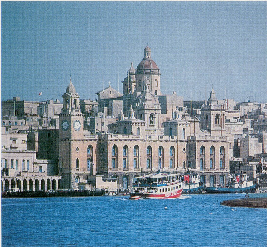
Der Hafen von Valletta auf Malta.