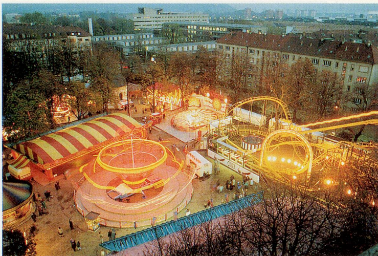
Natürlich gehört auch der Chilbi-Betrieb zur «Mäss». Doch sonst ist sie ein Jahrmarkt der leisen Töne.

Ist eine Messe ein kulturelles Ereignis? Nicht, wenn Kultur etwas Avantgardistisch-Zukünftiges ist, das die vertrauten Grenzen sprengt. Ja, wenn darin etwas von der Lebenskultur der Messegänger fühlbar wird. Eine solche Messe ist die Basler Herbstmesse.