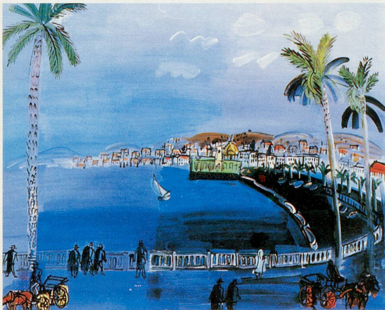
Nice, la Baie des Anges. Raoul Dufy, 1926.

Ab April ist das Verkehrshaus an der Lidostrasse 5 in Luzern täglich geöffnet von 9 bis 18 Uhr; Tel. 041/370 20 20.