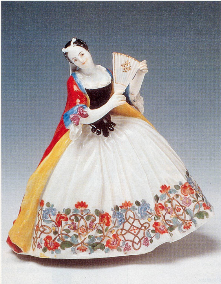
Dame mit Reifrock und Fächer, Meissen, Johann Joachim Kändler, um 1736