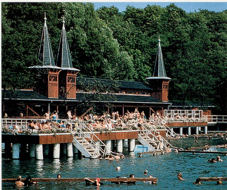
Thermalsee Hewiz in Ungarn