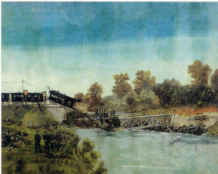
Am 14. Juni 1891 brach bei Münchenstein BL eine Brücke zusammen und riss den gesamten ersten Teil eines Zuges mit in die Birs. Es gab 80 Schwerverletzte und 130 Tote, vor allem Teilnehmer/innen und Gäste eines Sängersfestes.