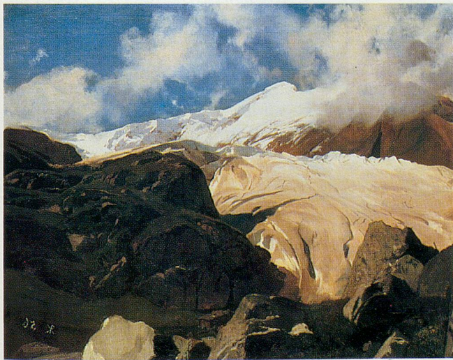
Rudolf Koller, Gletscher am Sustenpass, 1856

Öffnungszeiten: Di bis So 10–17 Uhr, Mi 10–21 Uhr, Tel. 01/383 43 76.