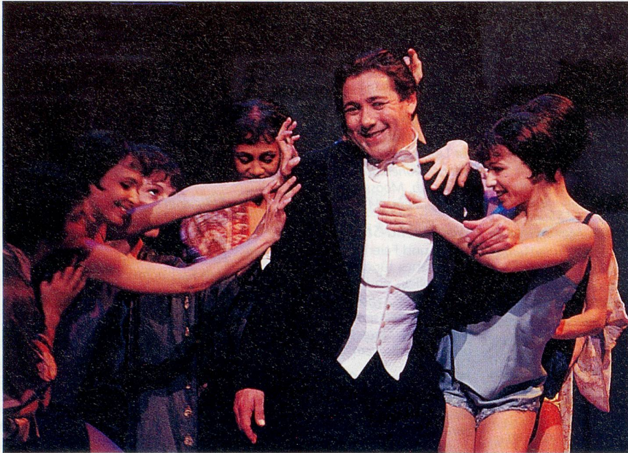
Jetzt im Berner Stadttheater: «Die Csárdásfürstin».