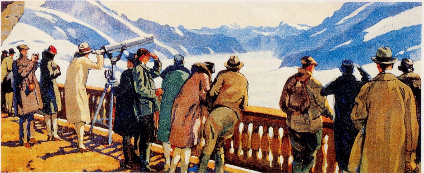
Die Schweizer Berge waren schon früh ein beliebtes Reiseziel der reisefreudigen Engländer.

Illustration aus dem Buch «Jungfrau – Zauberberg der Männer», erschienen 1996 im AS Verlag Zürich.